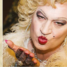
Der Ministerpräsident von Bayern, Markus Söder als Marilyn Monroe verkleidet.

Während einer Angstphase, wie der Corona-Krise, kann man sich politisch vorteilhafter positionieren und auch dem Bürger neue Gesetze aufzwingen, welche eine leichtere Handhabung mit Kritikern und Andersdenkenden gewährt. Grundgesetze wie in Bezug auf die Demonstrationsfreiheit werden eingeschränkt. Die Machtspiele der Politik sind im Bundestag live zu begutachten. Dort setzten sich Parteimitglieder unter Fraktionszwang ausschließlich für die Leitideen der eigenen Partei oder der Koalitionspartei ein und blockieren von vornherein sämtliche Ansätze anderer Fraktionen selbst wenn sie diese persönlich als gut empfinden. Selten gefährdet ein Abgeordneter seine Position innerhalb der eigenen Fraktion. Das gemeinsame Ziel, das Beste für die Bevölkerung zu entscheiden, wird oft zum Randthema. Es geht um Macht. Und Machtspiele haben in einer Demokratie nichts verloren!